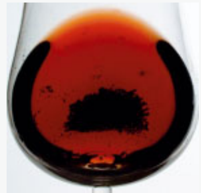
Fig 3.8. Figuren visar en typisk fällning, som påträffas i äldre, kraftigt macererade och ofiltrerade viner. Detta är ingen defekt utan fullt normalt. Fällningen består av en kombination av syror och fenoler (färgpigment och tannin). Då viner åldras, koagulerar fenolerna och bildar sediment med syrorna. Med tiden resulterar detta i ett ljusare vin, som tar mindre plats i flaskan, eftersom fällningen av fenoler och syror är kompaktare i sin koagulerade form.