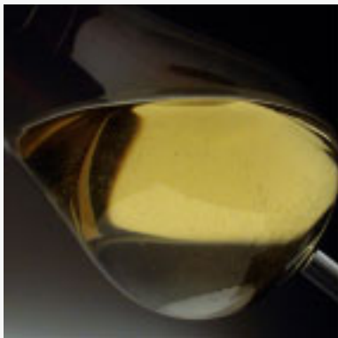
Fig. 3.6. Figuren visar en proteindefekt i ett vitt vin. Proteinflingor orsakas av varmt överskottsprotein, som koagulerar i vinet och bildar en grumlighet med små flingor. Detta kan förhindras med hjälp av bentonit.