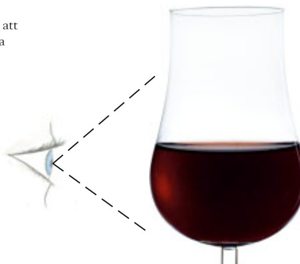
Fig. 3.3. Från sidan: Titta på vinets ben, dess viskositet och eventuella tecken på defekter.

Naturligt blåvitt ljus är bäst men inte nödvändigt. Ännu viktigare är en fast, reflekterande ljuskälla, när ett vins utseende analyseras.