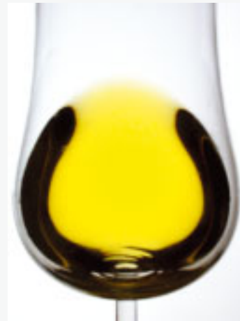
Fig. 3.5. Figuren visar ett kristallklart vin utan några tecken på defekter.