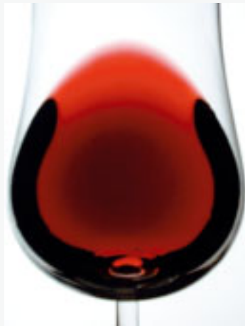
Fig. 3.4. Figuren visar ett klart vin utan några tecken på defekter.

6. Fällning (Fig. 3.8) är normal och förorsakas av åldrande. Fenomenet uppträder som små, mörka flingor eller bitar, som kan vara mycket finkorniga eller grövre men är ingen defekt.