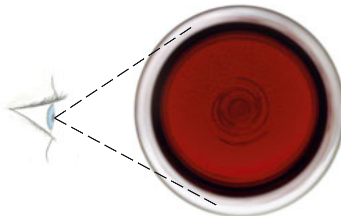
Fig. 3.1. Uppifrån (vertikalt): Titta på vinets yta, dess lyster, färgdjup, klarhet och konstatera eventuell kolsyra eller defekter.

1. Vertikalläge (Fig. 3.1). Genom att titta på vinet uppifrån, kan vi analysera vinets lyster på ytan, färgdjup, klarhet och färgdjup liksom potentiella defekter som bubblor ( \text{CO}_2 ), protein etc.