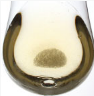
Fig. 3.7. Figuren visar kristaller av kalcium och vinsyra i ett vitt vin. Detta är ingen defekt som orsakats under produktionen utan snarare ett kosmetiskt irritationsmoment. Det orsakas av olika syror och kalcium under kalla lagringsförhållanden.